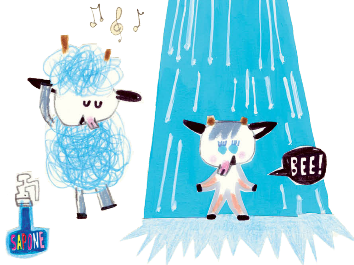
Illustrazione di Gry Moursund da I tre capretti furbetti al parco acquatico (Camelozampa, 2026)